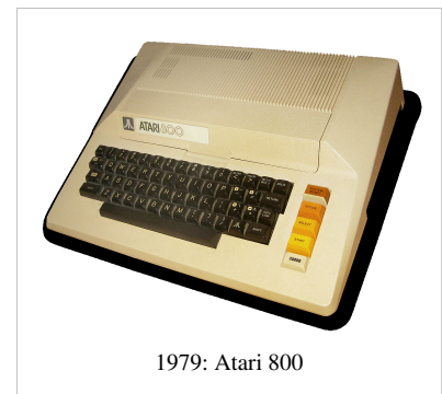
1979: Atari 800

Atari era una marca bien conocida a finales de los años 1970, tanto por sus exitosos juegos de arcade como Pong, así como por la enormemente exitosa videoconsola Atari VCS. Dándose cuenta que el VCS tendría un tiempo de vida limitado en el mercado antes de que viniera un competidor técnicamente avanzado, Atari decidió que ellos serían ese competidor, y comenzó a trabajar sobre un nuevo diseño de consola que era mucho más avanzado.